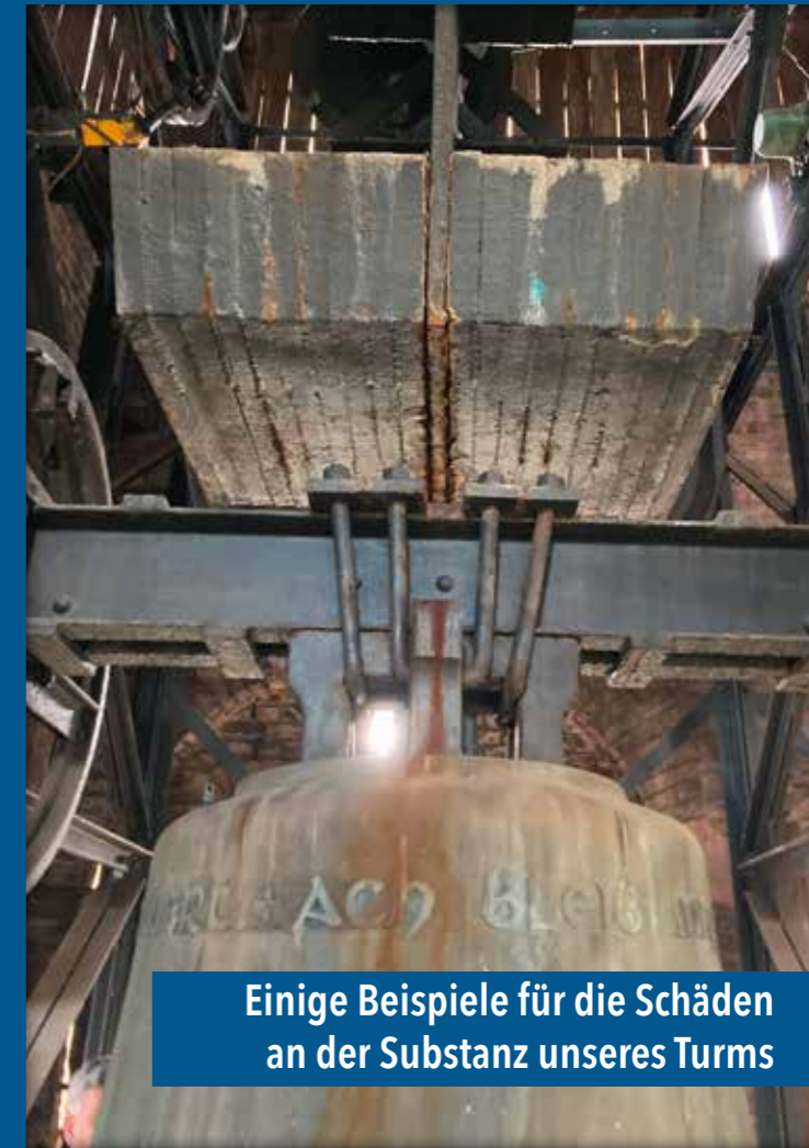
Einige Beispiele für die Schäden an der Substanz unseres Turms