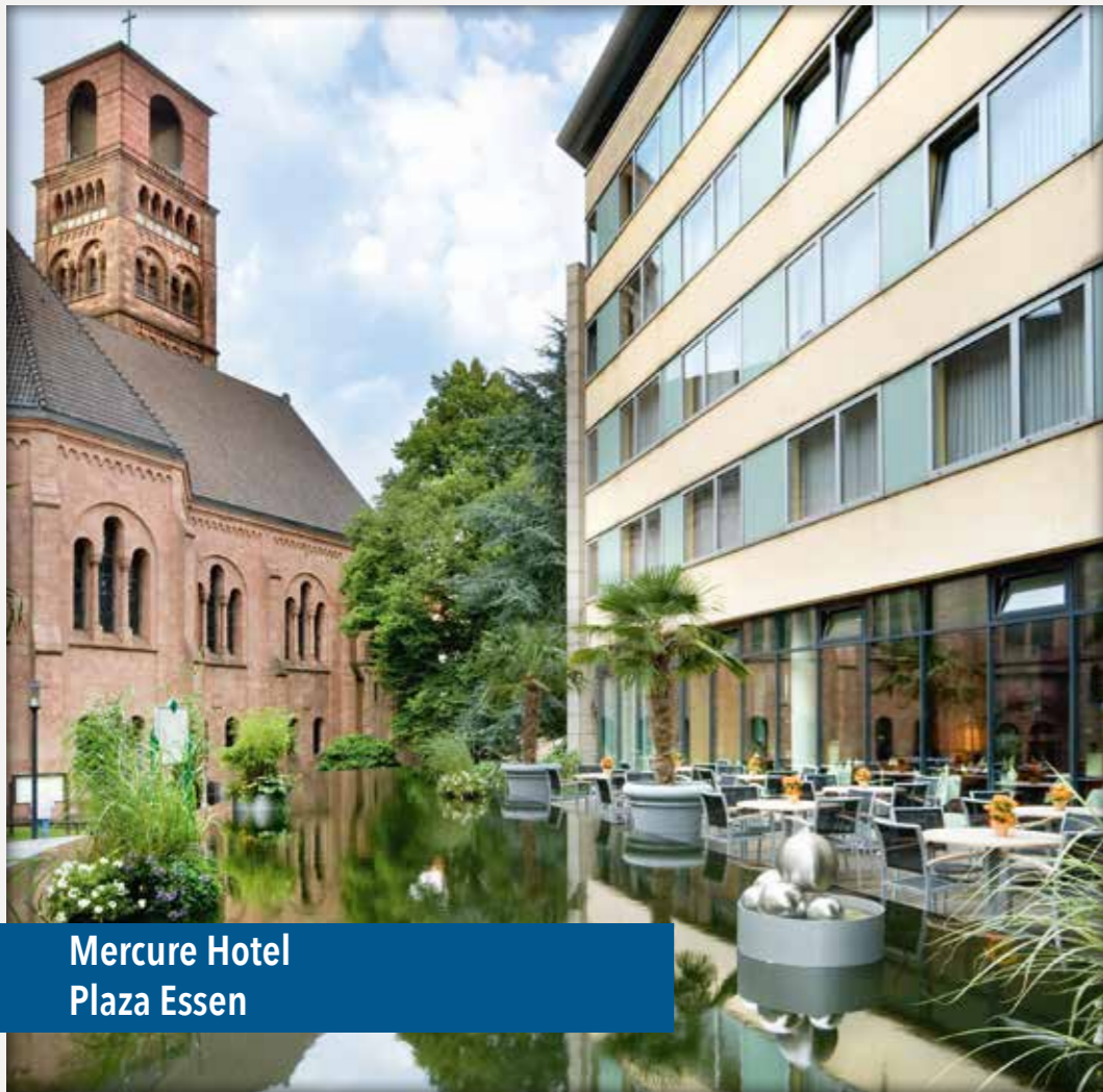
Mercure Hotel Plaza Essen

Die Erlöserkirche prägt diesen besonderen Ort mit ihrer Ruhe, Offenheit und Ausstrahlung.